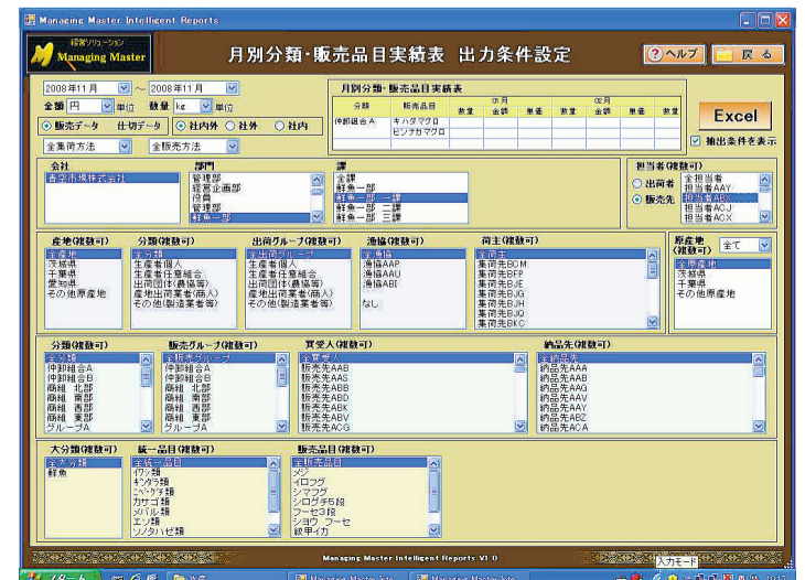
写真2 詳細設定画面

操作は「メインメニュー」画面の条件設定(パターン設定)から始まる。まず、表でいう縦方向と横方向を決定。項目としては時系列(月・旬・日)、出荷者(出荷地・原産地)・分類・出荷グループ・系統・荷主、販売先(販売グループ・買受人・納