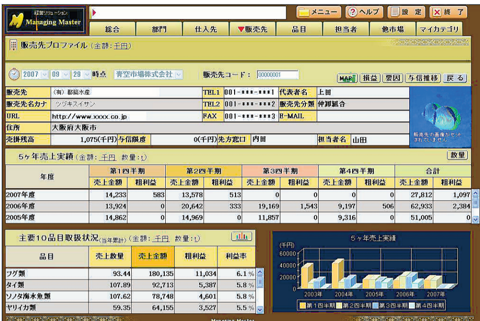
プロフィール画面

販売先、仕入れ先は過去5年間の取引実績（売上高、利益）、上位品目、担当者別など見たい項目から、さらに深く掘り下げた情報を取り出せる。原産地にも対応。東京や大阪などの商社が輸入した場合でも、産地（出荷地）と別に原産地項目を作成できる。例えば、原産地が中国の魚、製品を探する場合でも、すぐにピックアップが可能だ。集荷先状況では幾つかの部門で扱っていると、傾向が出ないため、「全部門」という項目が出てくる。会社全体に対するポジションが分かる。委託、買い付けについても販売面では品目別ランキングを作成できる。ターゲットを絞り込み簡単